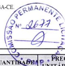
TABELA: SEINFRA 27.1 DESONERADA / SINAPI / COMPOSIÇÕES PRÓPRIAS

CLIENTE: PREFEITURA MUNICIPAL DE PACATUBA