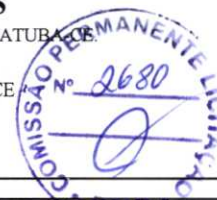
TABELA: SEINFRA 27.1 DESONERADA / SINAPI / COMPOSIÇÕES PRÓPRIAS

CLIENTE: PREFEITURA MUNICIPAL DE PACATUBA