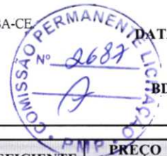
TABELA: SEINFRA 27.1 DESONERADA / SINAPI / COMPOSIÇÕES PRÓPRIAS

CLIENTE: PREFEITURA MUNICIPAL DE PACATUBA