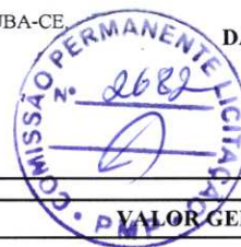
TABELA: SEINFRA 27.1 DESONERADA / SINAPI / COMPOSIÇÕES PRÓPRIAS