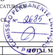
TABELA: SEINFRA 27.1 DESONERADA / SINAPI / COMPOSIÇÕES PRÓPRIAS