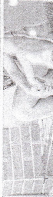
Técnico Vojvoda em treino do Fortaleza, no Pici

COM ATUAÇÕES extremamente sólidas em casa, o Fortaleza é o segundo melhor time da primeira divisão como mandante (são oito vitórias e três empates, saldo positivo de 12 gols), somando 81,8% de aproveitamento, atrás só do Cruzeiro, vencedor de todas as oito partidas que atuou em casa. Curiosamente, Cruzeiro e Fortaleza se enfrentam na segunda-feira que vem.