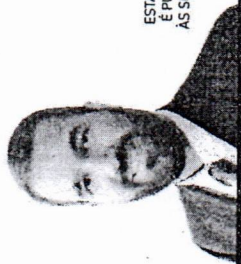
ESTA COLUNA É PUBLICADA AS SEGUNDAS